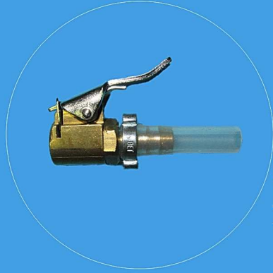
Adapter MB-SBC Bremsanlage 14.063