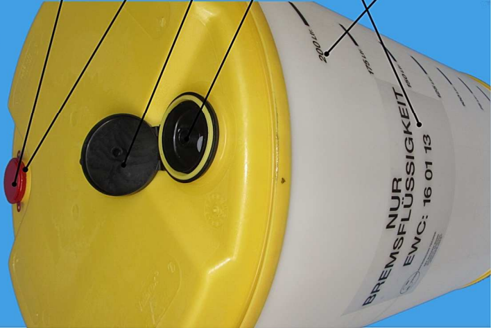
Siegelkappe rot 10.050