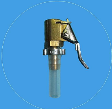
Adapter MB-SBC Bremsanlage 14.063